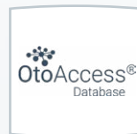
Base de datos OtoAccess®