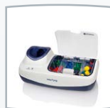
Base de carga