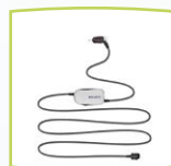
Sonda diagnóstica portable