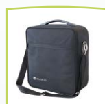
Estuche de transporte