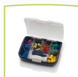
Juego de tapones