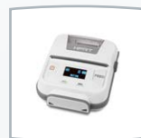
Impresora térmica inalámbrica HM-E200