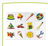
Tabla de imágenes