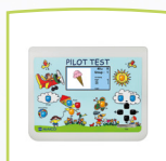
Dispositivo PILOT TEST