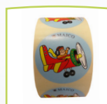
Rollo de calcomanías