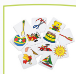
Imágenes de instrucciones