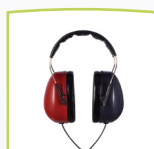
Audífono DD65 v2