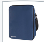
Estuche de transporte