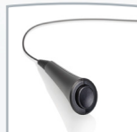
Interruptor de respuesta del paciente